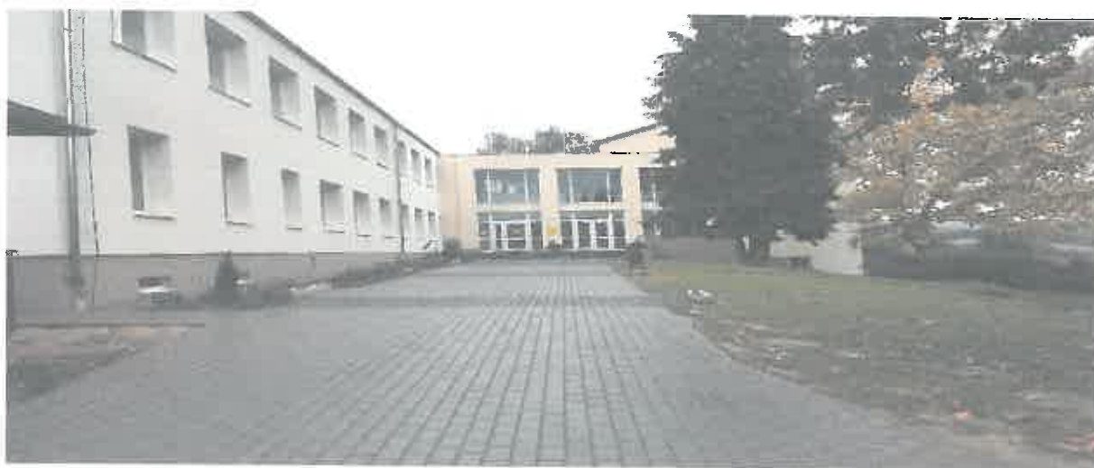
Szentbalázi Körzeti Általános Iskola 2021